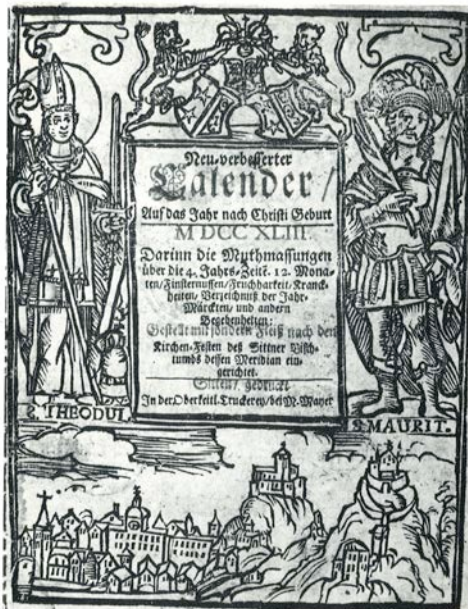
Grand Almanach, année 1743, imprimé par Jean-Michel Mayer. Coll. Médiathèque Valais | Sion

Disponibles sur demande au 027 324 11 39 ou par mail : g.metrailer@sion.ch