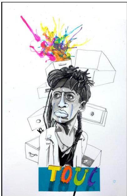
KT Gorique , techniques mixtes sur papier, 53 x 36 cm © Evique