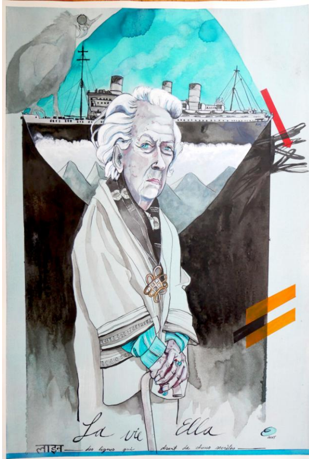
Ella Maillart , techniques mixtes sur papier, 53 x 36 cm © Evique