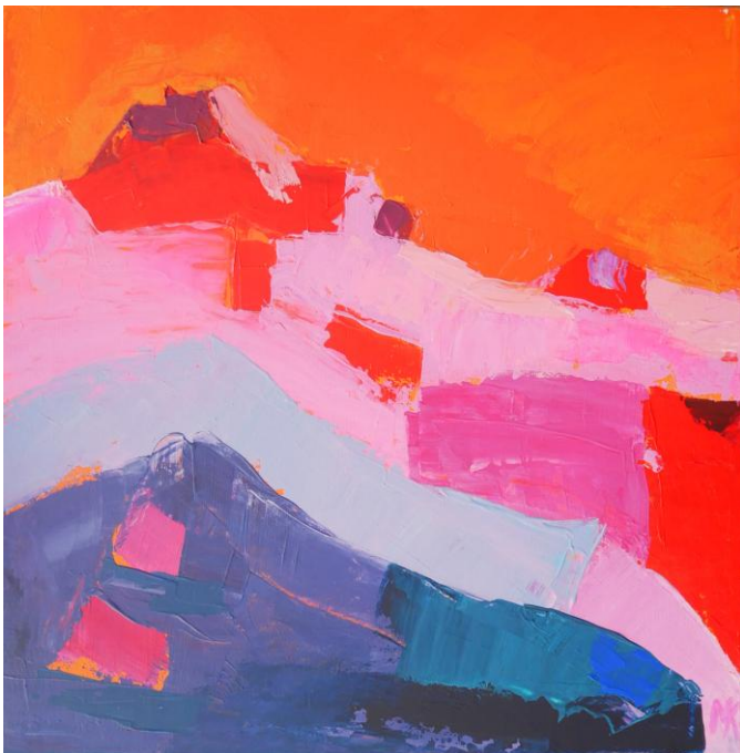
La pointe Dunant , acrylique sur toile, 30 x 30 cm © Marie K