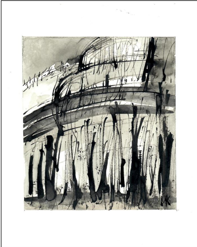
Vinea X , techniques mixtes sur papier, 16 x 14 cm © Marie K